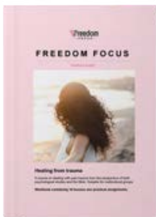
Freedom Focus Engelse publicatie

In oktober is het project Samen Geloven gestart samen met de kerk in Actie van de Protestantse Kerk Nederland. Beide organisaties vinden elkaar in het verlangen om Nederlanders en migranten met elkaar te verbinden, juist op geloofsgebied. In de komende vier jaar werken we intensief samen om een beweging op gang te brengen waarin plaatselijke (PKN) gemeenten meer geloofscontacten aangaan met mensen met een migratieachtergrond. In het eerste projectjaar doen we onderzoek naar de factoren die bijdragen aan succesvolle relaties op geloofsgebied. Ook onderzoeken we hoe dit verder in Europa vorm krijgt. Verder zijn we gestart met de begeleiding van een aantal pilotgemeenten en ontwikkelen we materiaal dat in de komende jaren breder beschikbaar gesteld wordt.