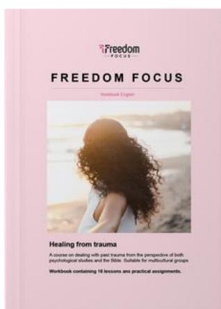
Freedom Focus Engelse publicatie

Tijdens 2022 hebben we op veel verschillende manieren kerken en predikanten geadviseerd. We hebben bij het Oekraïneproject (zie 2.4) predikanten toegerust voor de pastorale begeleiding van Oekraïense vluchtelingen. Verder verzorgden we colleges en in de zomer hielden we samen met bevriende stichtingen uit het netwerk 'kerk en migrant' een zomerschool over de kansen en knelpunten voor kerken in het samen kerk zijn.